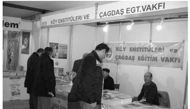
20 - 28 MART ANKARA KİTAP FUARINA KATILDIK. YAZARLARIMIZLA İMZA GÜNLERİ DÜZENLEDİK VAKFIMIZI VE YAYINLARIMIZI TANITTIK