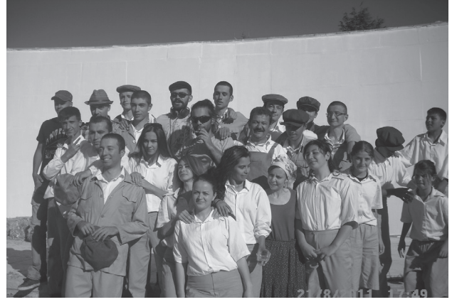
“Toprağın Çocukları” oyuncularından bir bölümü