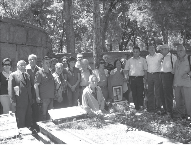
Ölümünün 51. Yılında İsmail Hakkı Tonguç'u mezarı başında andık.

Aynı yasaya göre kızlardan 3.sınıfı bitirenlere bir kısmı sağlık bakanlığınca açılacak köy ebe okullarında yetiştirilecek ve köylere 1.sınıf ebe olarak atanacaklardı. Bu gerçekleşmemiştir. Yani Köy Enstitüsü çıkışlı ebe yoktur. Karışıklık aynı bakanlığın 2. sınıf ebe yetiştirilen farklı bir ebe okulları oluşundan kaynaklanmış olabilir.