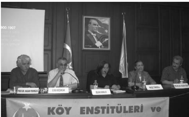
21 Haziran 2008 Tonguç'u Anma Açık Oturumu

Gelecek sayı da görüşebilmek dileğiyle herkese bol okumalı, iyi dinlenceler... ■