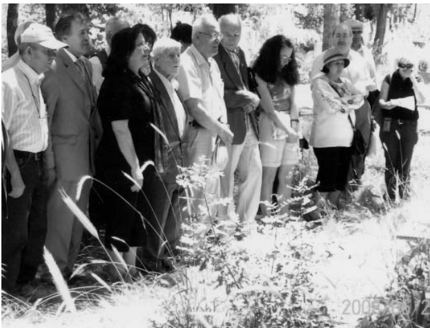
23 Haziran 2008 Tonguç'u Mezarı Başında Andık

1945'te çıkarılan 6234 sayılı yasa ile Köy Enstitülerinin adı "İlköğretmen Okulu" olarak değiştirildi. Böylece Köy Enstitüleri dolaylı kapatılmış oldu. Nüfusun %80'ni oluşturan köy halkının bilinçlenme, köy çocuklarının okuma olanakları ellerinden alınmıştır.■