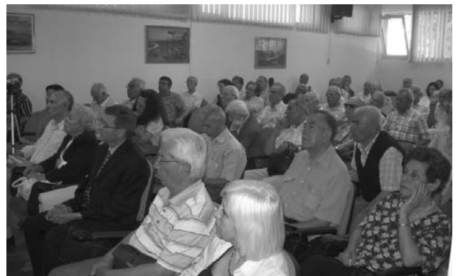
21 Haziran 2008 Tonguç'u Anma Toplantısında İzleyiciler