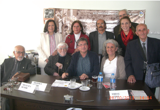
26 Ekim 2013, Fakir Baykurt'u Anma Etkinliği: Katılımcılardan bir bölümü...