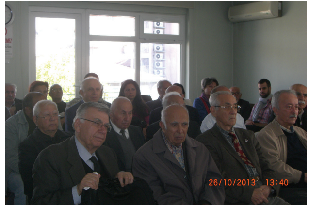
26 Ekim 2013, Fakir Baykurt'u Anma Etkinliği izleyicileri...

Bağışlarımız için; Posta Çeki No: 524699 Ziraat Bankası Kızılay Şubesi: IBAN: TR420001000685390292475003