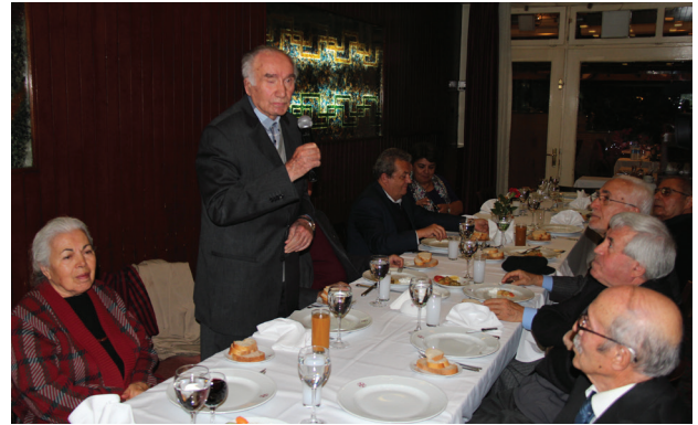
Çankaya Belediyesi tarafından verilen yemekte Mahmut Makal konuşma yaptı...