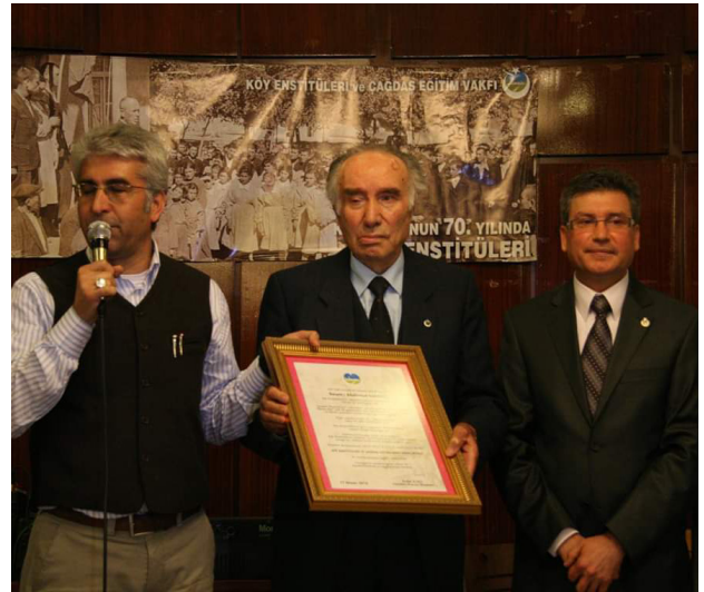
Mahmut Makal vakfımızın Eğitim Emek Ödülü’nü almıştı (2010)