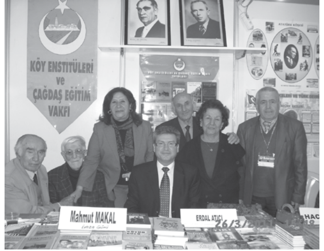
Ankara Kitap Fuarı Köy Enstitüleri ve Çağdaş Eğitim Vakfı kitap sergi yerimiz.

"17 Nisan'ı Anmak" Cumhuriyet 25 Nisan 1986